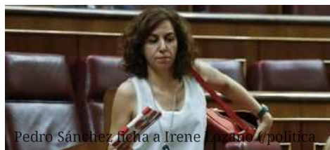
Pedro Sánchez ficha a Irene Lozano (politica/Pedro-Sanchez-Irene-Lozano-PSOE_0_441656940.html)