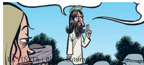
LA VIÑETA | Bienaventurados los perseguidos (Viñetas/Bienaventurados-perseguidos_10_441755826.html)