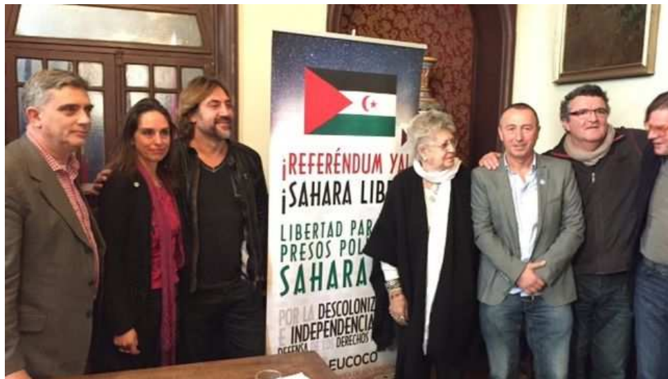
Varios firmantes del manifiesto y activistas de CEAS Sáhara/ FiSáhara

No es la primera vez que lo piden, llevan 40 años haciéndolo, pero sigue sin pasar nada en el Sáhara Occidental. Por eso, señalan, están ahí para recordarlo. Más de 150 cineastas, actores, periodistas, músicos y activistas han firmado un manifiesto en el que solicitan al Gobierno español, como potencia administradora, que "ponga fin a su proceso de descolonización, inconcluso desde 1975". Durante este mes España ocupa la presidencia del Consejo de Seguridad de la ONU, por lo que el movimiento pro saharauí solicita al Ejecutivo que utilice su posición y presione a la comunidad internacional para lograr el fin de un conflicto que ha dejado cerca de 150.000 refugiados.